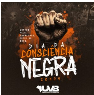
20 de novembro dia da Consciência Negra 20/11/2025