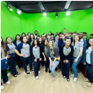
Erechim/RS-Com incentivo da Presidente Mirim da Câmara, alunos do 8º ano da Escola Paiol Grande visitam a Casa Legislativa 24/11/2025