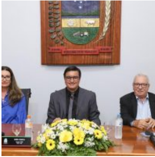
Câmara de Encantado/RS realiza Semana Legislativa com formação cidadã e homenagens 24/11/2025